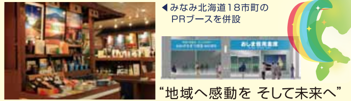
◀みなみ北海道18市町のPRブースを併設